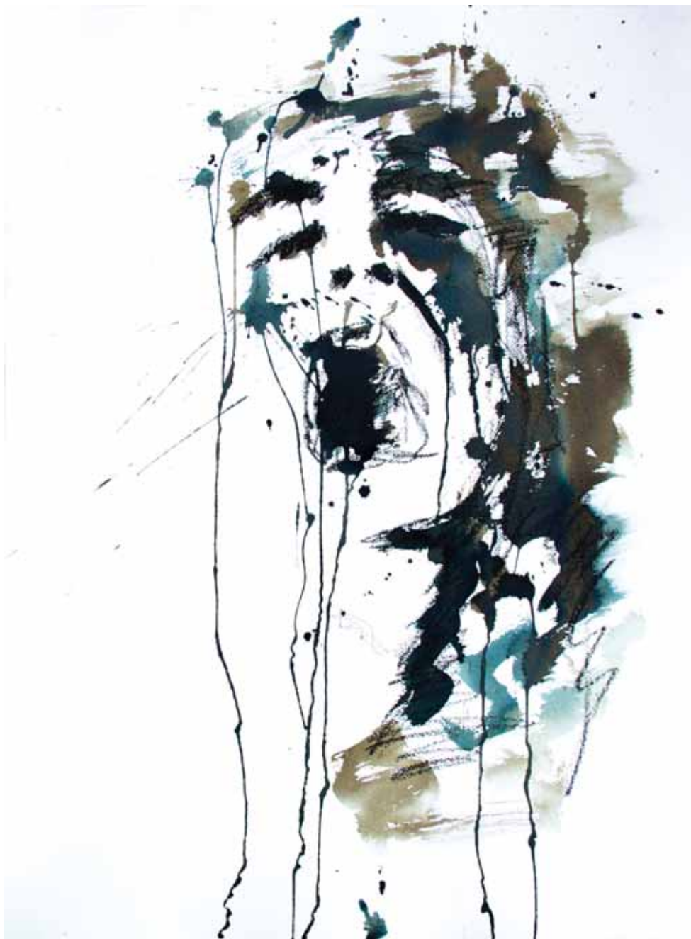
Tourments 1 Techniques mixtes - 78 x 56 cm - 2015

[...] Cette souffrance s'exprime également à travers les visages de personnages criant, Série « Tourments ». Seul le cri existe. La tête se fait masque tragique biffé de taches, oblitéré de traces de craie appuyées, tout ceci établissant de forts contrastes.