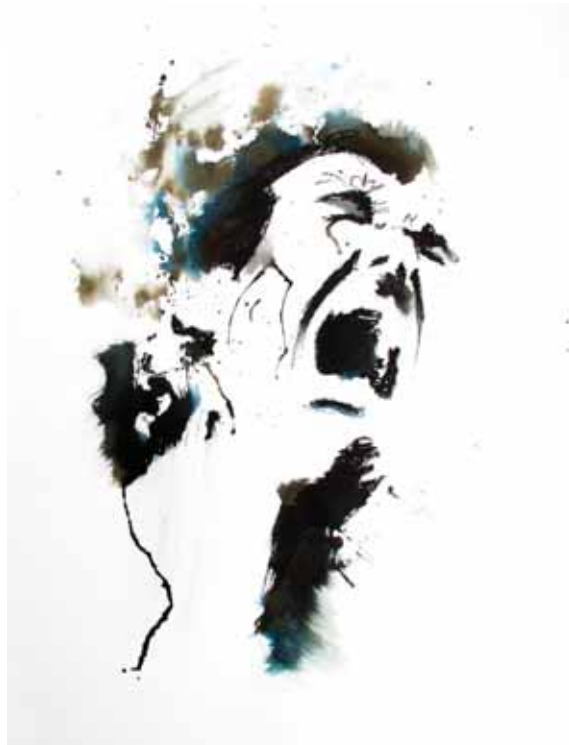
Tourments 3 Techniques mixtes 78 x 56 cm 2015