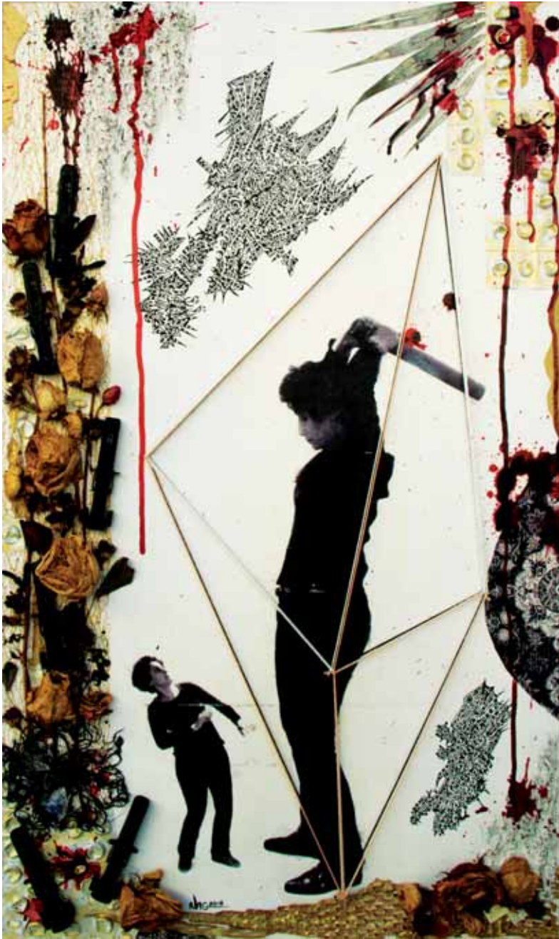
Série Autoportrait, Diptyque B1 Techniques mixtes - 80 x 47 cm - 2018