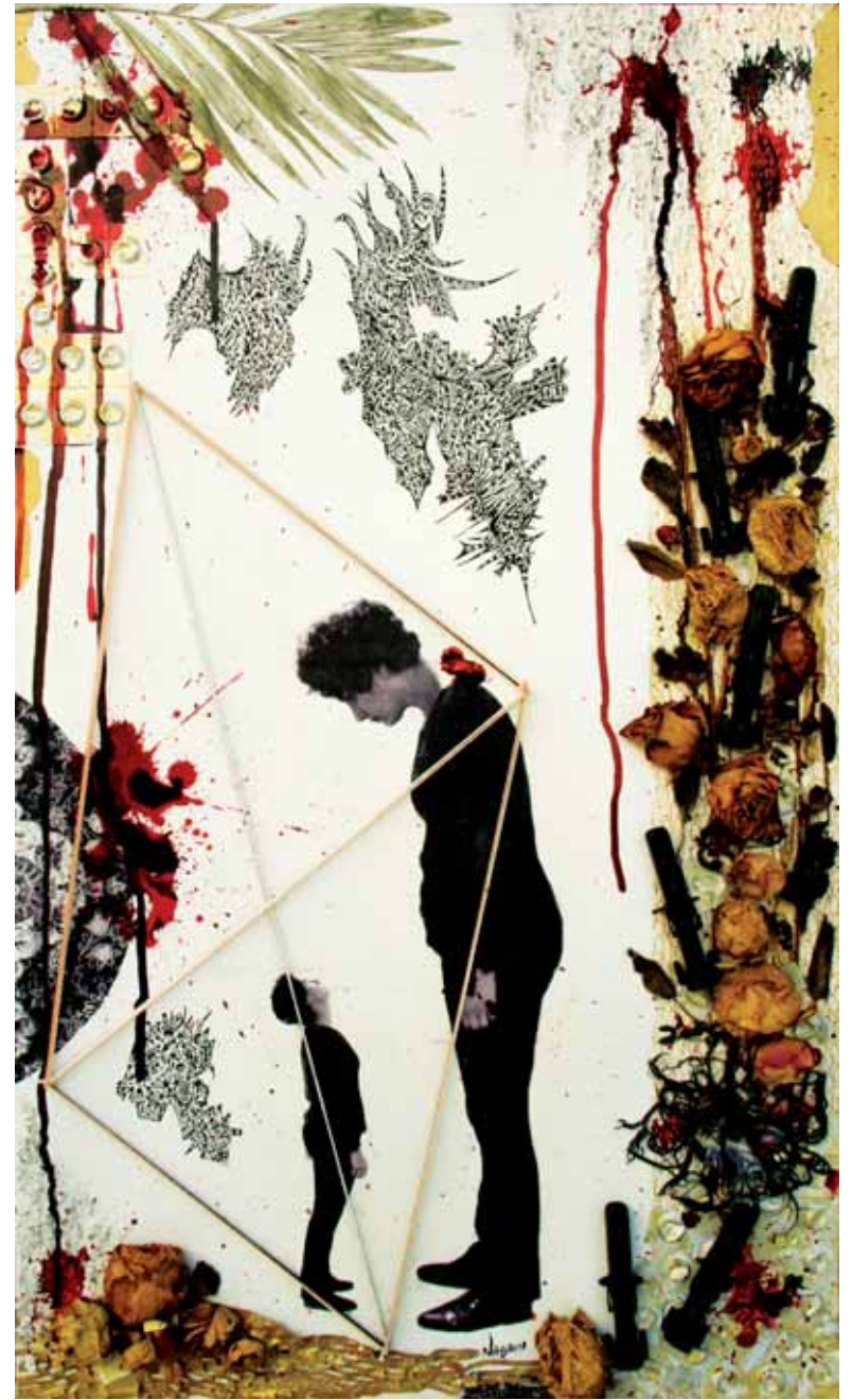
Série Autoportrait, Diptyque B2 Techniques mixtes - 80 x 47 cm - 2018