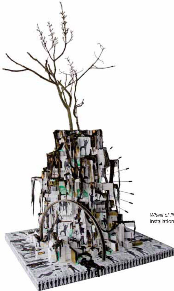
Wheel of life Installation - 2018

[...] Ailleurs, « Wheel of life », une autre pyramide s'érige, composée de boîtes de médicaments ingérés par l'artiste. Des coulures couvrent certains conditionnements. Les cartonnages s'élèvent, enserrant la base d'un petit arbre sec hérissé de filins transparents. Une demi-roue de bicyclette aux rayons hérissés traverse l'ensemble, évoque la dangerosité tapie des traitements accumulés.