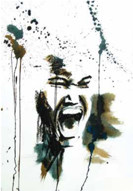
Tourments 8 Techniques mixtes 50 x 35 cm 2017