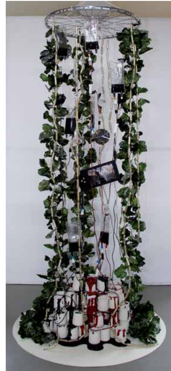
Vie suspendue Installation - 2018

[...] Ailleurs, « Wheel of life », une autre pyramide s'érige, composée de boîtes de médicaments ingérés par l'artiste. Des coulures couvrent certains conditionnements. Les cartonnages s'élèvent, enserrant la base d'un petit arbre sec hérissé de filins transparents. Une demi-roue de bicyclette aux rayons hérissés traverse l'ensemble, évoque la dangerosité tapie des traitements accumulés.