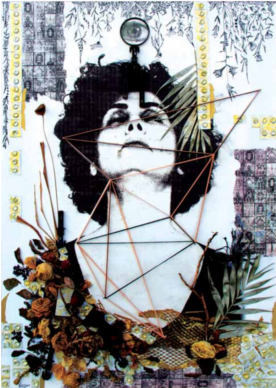
Série Autoportrait, Diptyque A1 Techniques mixtes - 100 x 70 cm - 2017