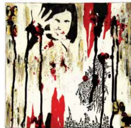
Algie 3 Techniques mixtes - 27 x 26 cm - 2017