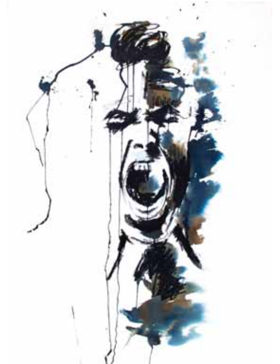
Tourments 6 Techniques mixtes 78 x 56 cm 2015