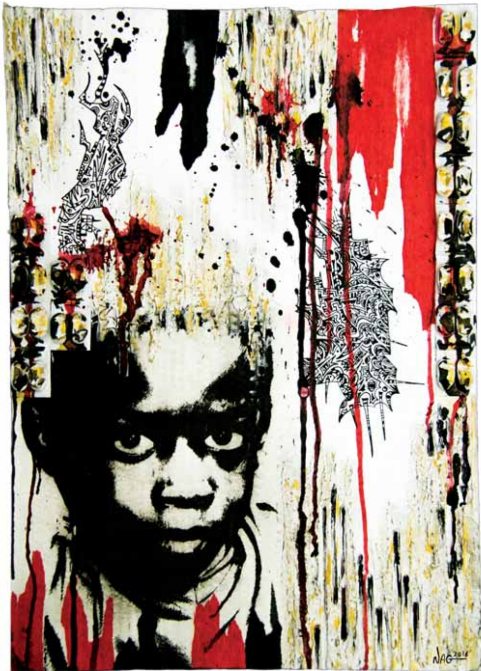
Algie 1 Techniques mixtes - 47 x 33 cm - 2016