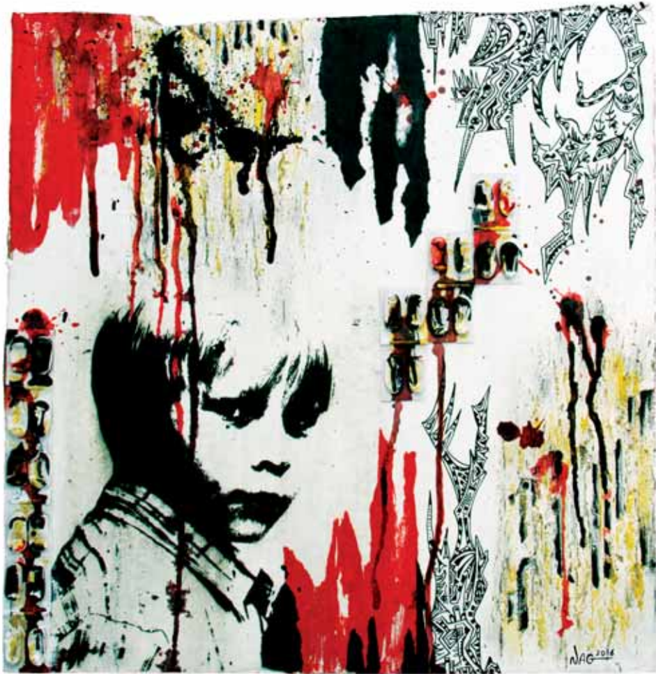
Algie 2 Techniques mixtes - 40 x 41 cm - 2016