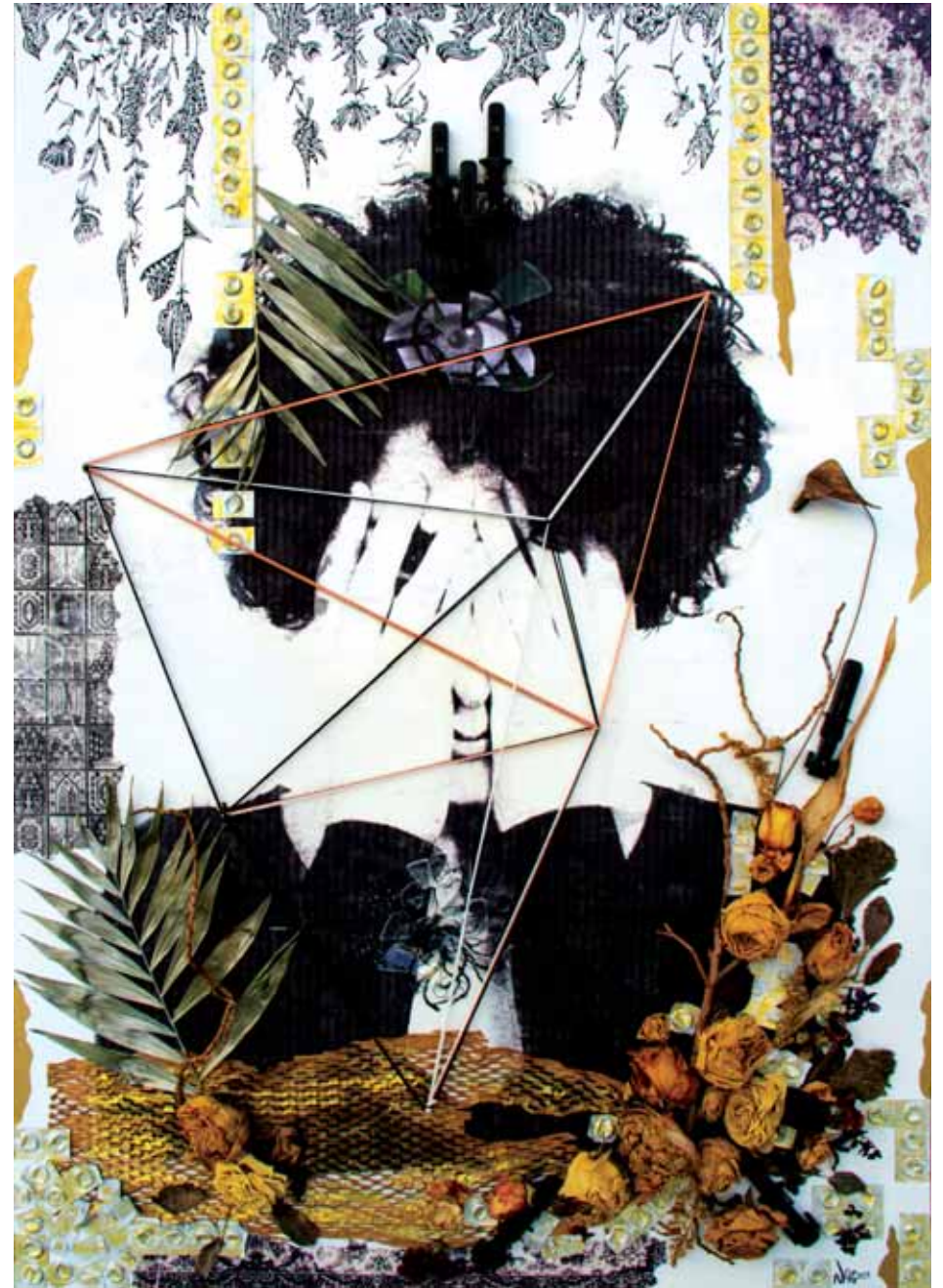
Série Autoportrait, Diptyque A1 Techniques mixtes - 100 x 70 cm - 2017