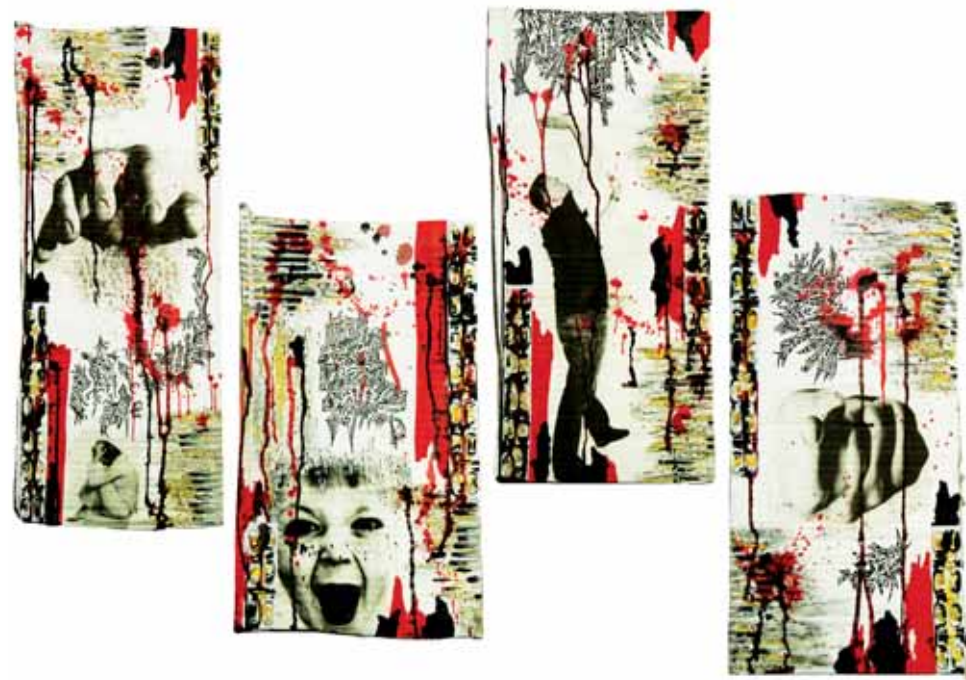
QuadrAlgie Techniques mixtes - 72 x 107 cm - 2016

[...] Dans d'autres œuvres sur cartons, Série « Algie », cette même fragilité s'exprime d'abord à travers le support, NAG semble s'inscrire dans le provisoire, le déplacement constant à travers le temps et l'espace. Il y a urgence à réaliser, c'est quelque chose qui semble résulter de son mode de vie. Dans ce travail, par endroits, le carton qui constitue le fond se désagrège en creux comme pour compenser le relief des capsules de médicaments peintes. Tout ceci constitue le « décor » autour des figures altérées, en partie effacées. Ici encore les dessins proliférant, les giclures de noir et de rouge viennent équilibrer les compositions dans un chaos paradoxal.