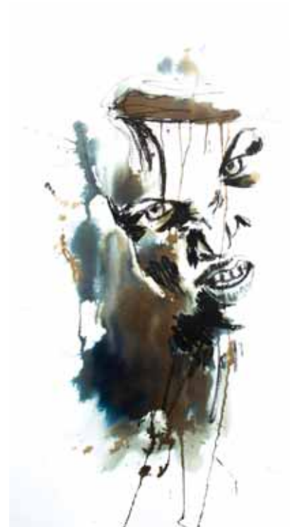
Tourments 7 Techniques mixtes 78 x 56 cm 2015