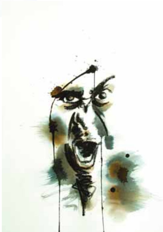
Tourments 9 Techniques mixtes 50 x 35 cm 2017

Les textes de ce catalogue ont été rédigés par Philippe Briard www.philippebriard.com