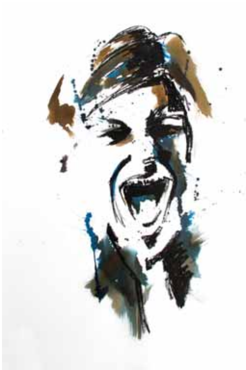
Tourments 2 Techniques mixtes 78 x 56 cm 2015