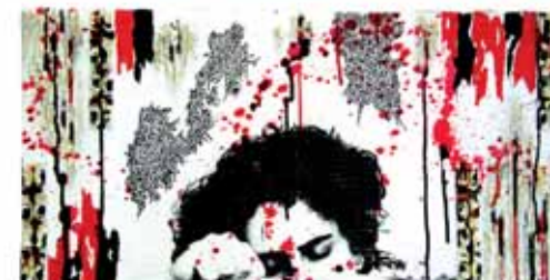
QuinrAlgie Techniques mixtes - 184 x 63 cm - 2017